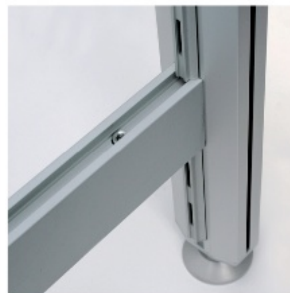
HLE - TR5 - PR5.AT30