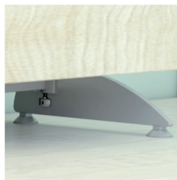
BSP.AS36 - PIE.AL08