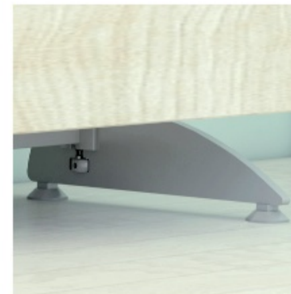
BSP.AS36 - PIE.AL08