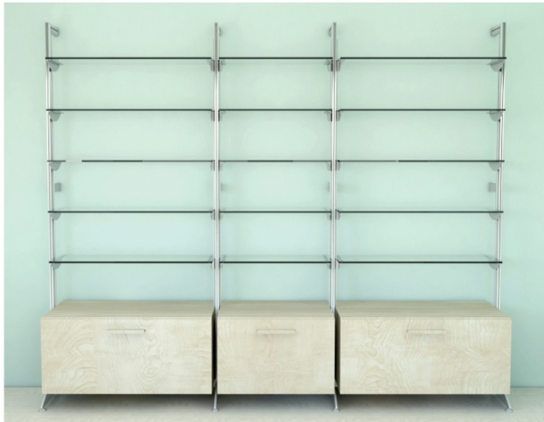
'ALPHA HLE WALL45' - aufgebaut mit RMC und RMS