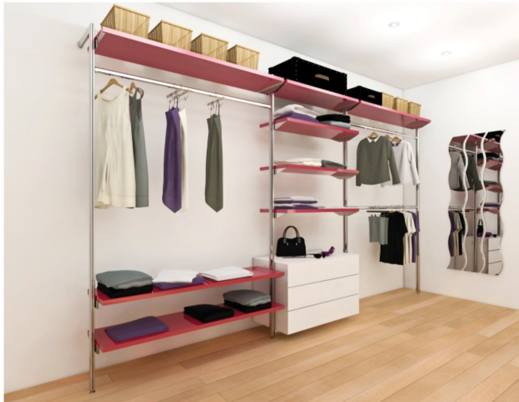
'ALPHA WALL45' - aufgebaut mit RMC und RMS